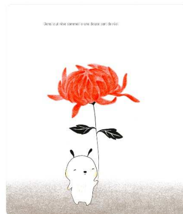
Image : ©Grasset éditions 2019 Sandrine Kao ( https://www.opalivres.com/ )