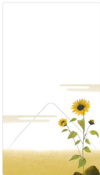
Image : ©Grasset éditions 2019 Sandrine Kao ( http://www.leslecturesdeliyah.com/ )

Un joli livre pour enfants qui porte très bien son nom ! A découvrir !