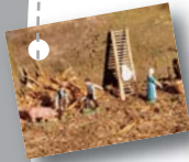
Planche Produits de la ferme

1 Quelque chose se prépare. Que va-t-il se passer ? Dans quelle intention ?