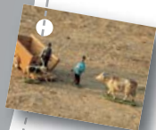
Planche La basse-cour

1 Devant le petit cochon qu'il rencontre, le dindon gonfle ses plumes, comment nomme-t-on cette action ? Et cette sorte de crête qui pend à côté de son bec ?